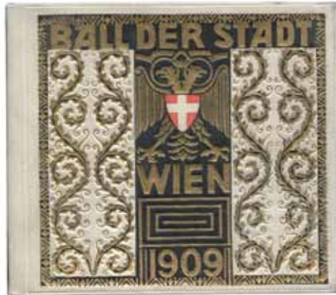
Hübscher Originaleinband von Wilhelm Meister

9 (Geyling, Remigius). Ball der Stadt Wien. Gedenktage aus dem Jahr 1809. (Wien), Wilhelm Melzer, (1909) € 480